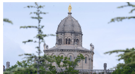
Citadelle de Forcalquier

6 Au poteau «Ongles» 7 à Cures, quitter le GRP® pour le ravin de Combe Crue, jusqu'à rejoindre la D 950. Prendre à droite et la suivre jusqu'au Gîte équestre Les Granges , lieu d'étape. 7