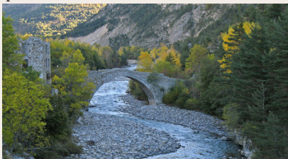
Le Verdon et le pont du Moulin à Thorame-Haute

Nous arrivons à présent dans le tunnel du Fayet, qui permet de nouveaux points de vue du Verdon, grâce à des ouvertures aménagées pour les randonneurs, le chalet de la Maline est incontournable pour accéder au sentier Martel et sur la rive gauche l'Auberge des Cavaliers est un point de départ pour le sentier de l'Imbut et le GR99.