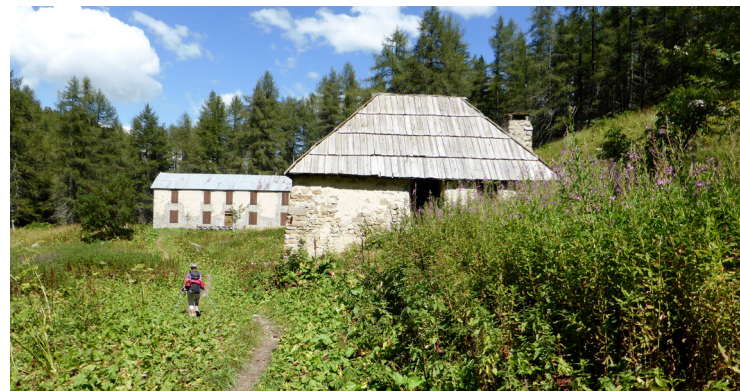
Maison forestière de Plan Bas