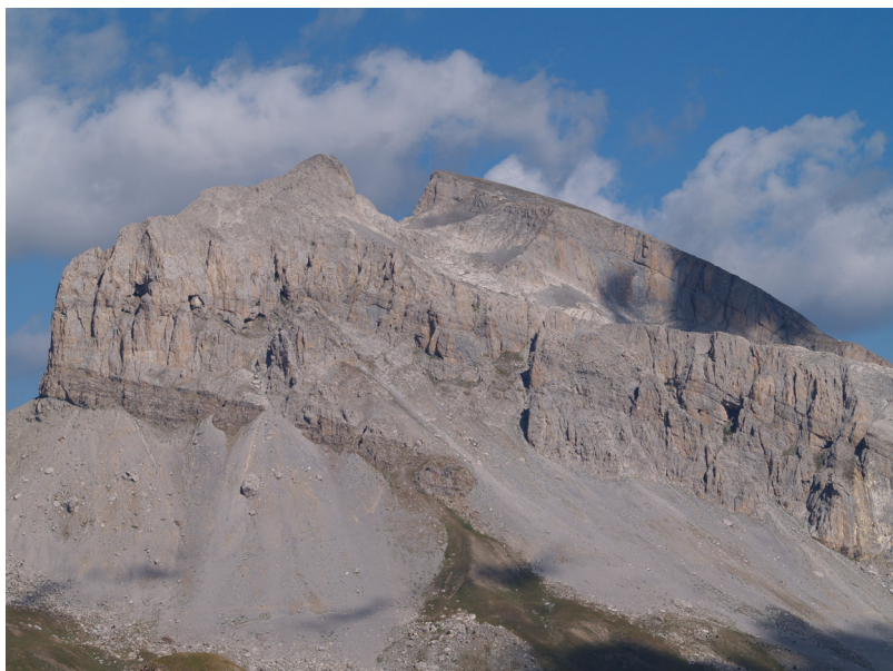
La Grande Séolane

Échelle de difficulté : Très Facile – Facile – Moyen – Difficile .