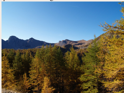
Mélèzes en automne.

n'en paraît rien au premier abord, ces forêts ont besoin de l'homme pour perdurer car le mélèze est une essence de lumière qui se régénère difficilement sous lui-même. Or, le montagnard en a toujours pris le plus grand soin comme d'une véritable richesse : son luxuriant sous-bois offre un excellent pâturage et son bois imputrescible fut longtemps indispensable pour faire des charpentes, des bardeaux de toit, des meubles, des conduites d'eau, des abreuvoirs comme pour le chauffage.