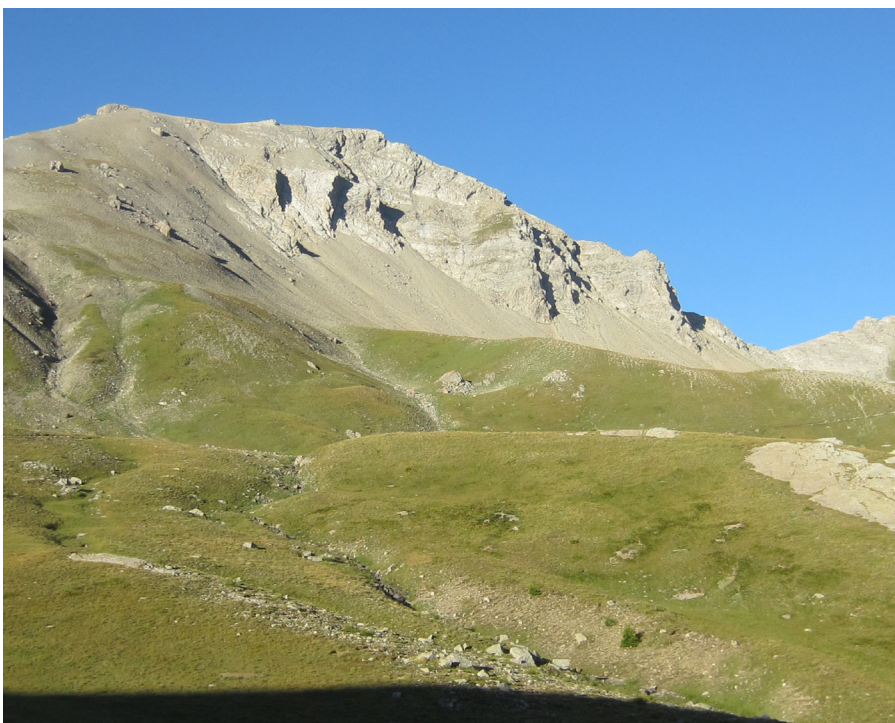
Col de la Cayolle

"Le tour du Pelat" est une boucle sur trois jours. En option un 4 ème jour : sommet du Pelat. Cette fiche présente le descriptif de la deuxième journée (partie "est") : des cabanes du Talon au refuge du col de la Cayolle.