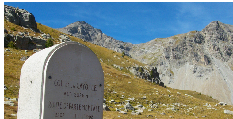
Col de la Cayolle