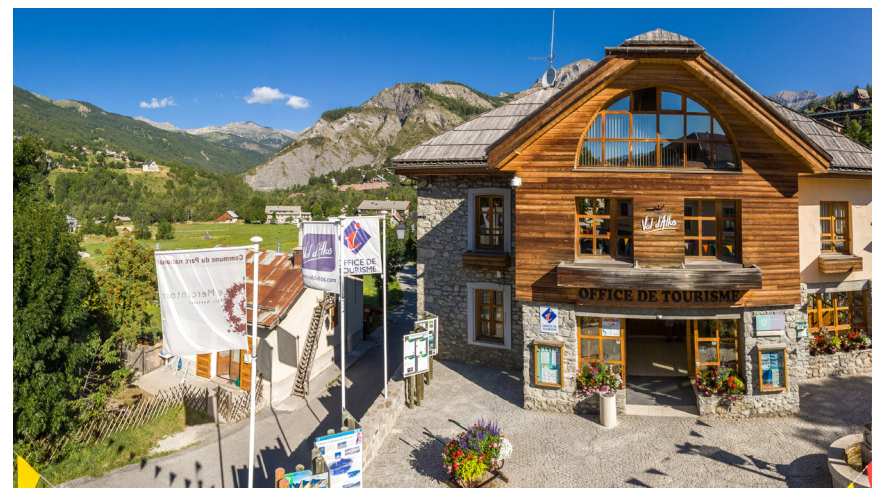
Office de tourisme du Val d'Allos.

Fin de la 1 ère journée de la boucle 6 au point 4 (refuge du col d'Allos) - 2240m. 4