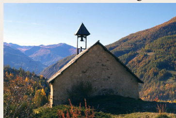
La Chapelle St-Pierre

gion, la peste, les rattachements alternatifs à la France et à la Savoie. La chapelle est implantée en bordure sud des plateaux de St Pierre, les Colettes et Bouchier. Deux tours ruinées, de dimensions identiques aux siennes, l'encadrent ; une face à l'est face à Vacheresse, l'autre à l'ouest dominant les ravins de l'Ubac et du Bouchier. L'ensemble révèle la volonté de défense d'une ancienne zone refuge. La Chapelle Saint-Pierre s'impose en Sentinelle protectrice des populations valléennes et montagnardes.