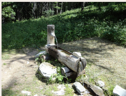
Congerman, la fontaine.

torrents. Le reboisement est complété par l'aménagement du lit des torrents par des seuils et des barrages, ainsi que par le contrôle des glissements de terrains et des couloirs d'avalanches. A Villars-Colmars, un kiosque-exposition donne une excellente information sur l'histoire et les actions de la RTM, sur ce thème également le sentier botanique en forêt de Ratery. Dans le cadre des circuits «Retrouvance», des gîtes ONF permettent de découvrir les milieux et de dormir en forêts : Fruchière et Congerman (seulement en été).