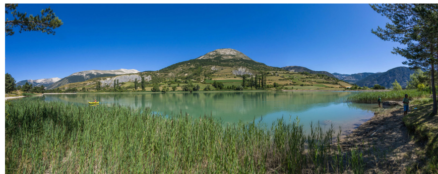
Le lac des Sagnes

Fin du 2 ème jour de la boucle 4 au point 5 (place de Thorame-Basse) - 1142m. 5