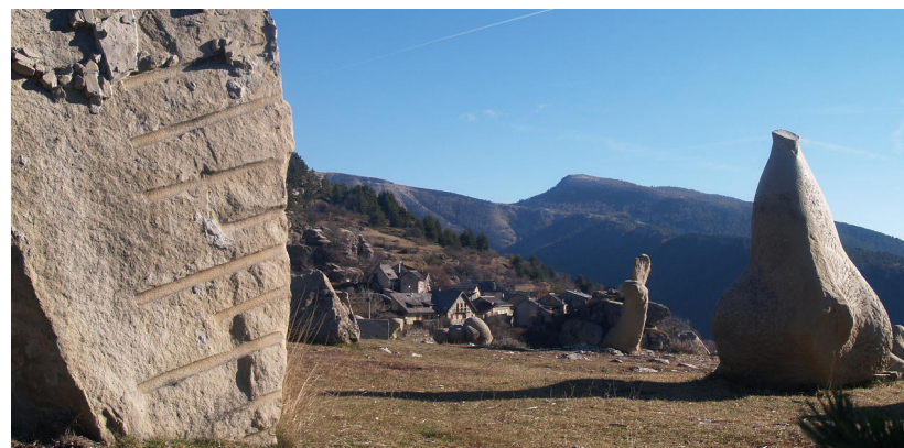
Sculptures à l'entrée de Peyresq