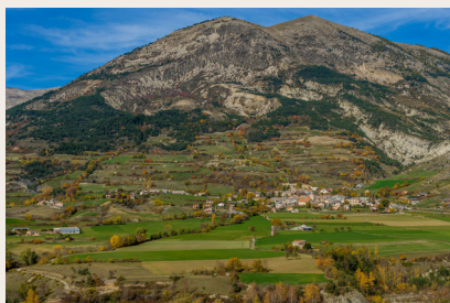
Vue de Thorame-Haute et ses forêts

boisés. Les forêts ne sont plus seulement des outils de production de bois, mais également des lieux de promenade, des refuges pour la faune sauvage ou encore des barrières contre les risques naturels. Le sylviculteur ne travaille pas pour lui mais plutôt pour ses petits-enfants, ce qui le rend humble et patient dans un monde où le profit doit être immédiat. Une petite citation à propos de la sylviculture : "imiter la nature et hâter son œuvre" (Lorentz et Parade, 1825).