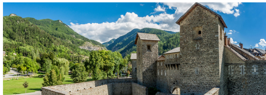
Fort de Savoie