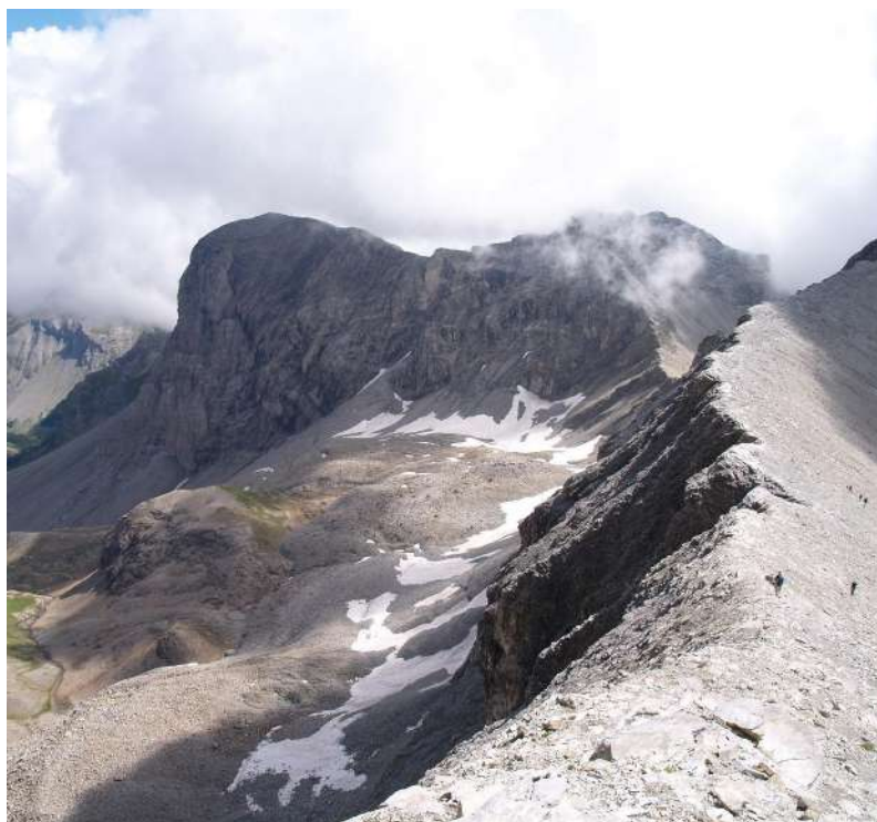
La Grande Barre vue du Pelat

Échelle de difficulté : Très Facile – Facile – Moyen – Difficile .