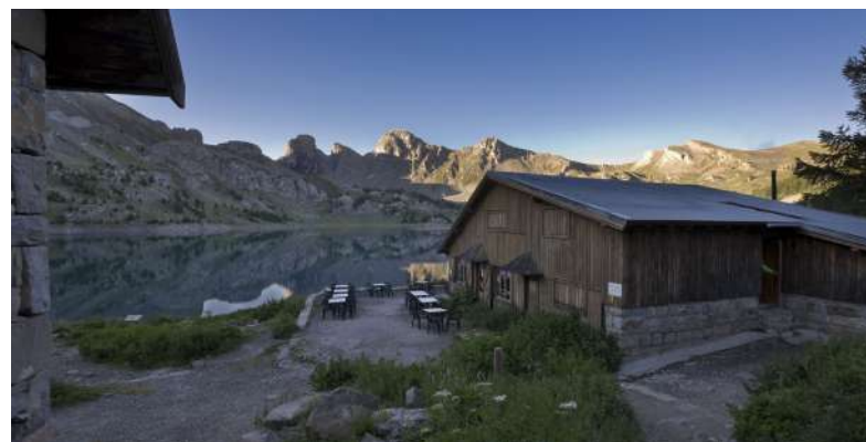
Refuge du lac d'Allos