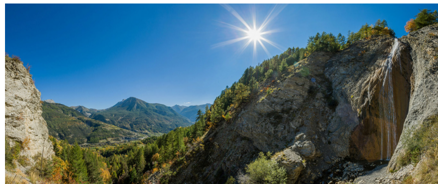
Cascade de Chaumie

Fin du 1 er jour de la boucle 1 au point 5 (Le Seignus - Bas) - 1515m. 5