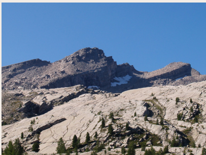
L'Estrop et le glacier de la Blanche

roche se fracture et forme des éboulis ; enfin, le gaz carbonique qu'elle contient dissout le calcaire, donnant alors un modelé karstique. Les grès d'Annot sont des roches spécifiques du Mercantour. Faits de sable et de vase consolidés, ils ont été formés, il y a 45 millions d'années, par des "courants de turbidité" ou gigantesques avalanches sous-marines dont la récurrence était de 100 000 ans. Elles étaient déclenchées par un séisme ou un apport brutal de sédiments par les fleuves issus du continent corsarde, dont les massifs des Maures et de l'Esterel, la Corse et la Sardaigne sont les vestiges. Texte : Parc national du Mercantour.