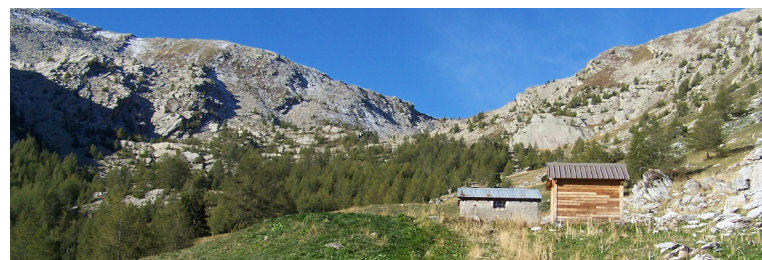
Cabane forestière de l'Auriac.

Fin du 1 er jour de la boucle 1 au point 4 (refuge de l'Estrop) - 2050 m. 4