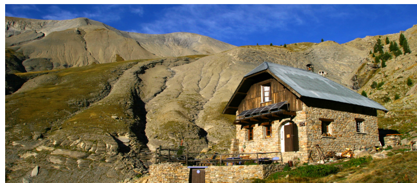
Refuge Roger Carle dit "refuge de l'Estrop".